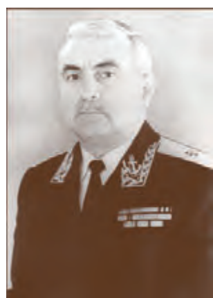
Контр-адмирал Н.К. Федоров (1976–1979)