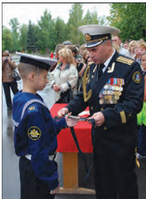
Ленточка КМЖК – символ принадлежности к морскому братству

ния кадетского корпуса – это взаимное сотрудничество и объединение возможностей двух соучредителей на основе Договора между правительством Санкт-Петербурга – для решения социальных проблем города и Военно-Морским Флотом – с целью подготовки кадров для поступления в высшие военно-морские учебные заведения. Это сотрудничество было успешным. А вскоре распоряжением Президента Российской Федерации от 19 февраля 1996 г. № 73-рп Первый морской кадетский корпус был преобразован в Кронштадтский морской кадетский корпус и приобрел статус военно-морского учебного заведения. Этим постановлением была определена численность корпуса – 700 кадет и установлен семилетний срок обучения – с 10 до 17 лет по типу старых кадетских корпусов императорской России. Главным отличием Кронштадтского морского кадетского корпуса от аналогичных учебных заведений в тот период являлось то, что только здесь воспитывались мальчики после начальной шко-