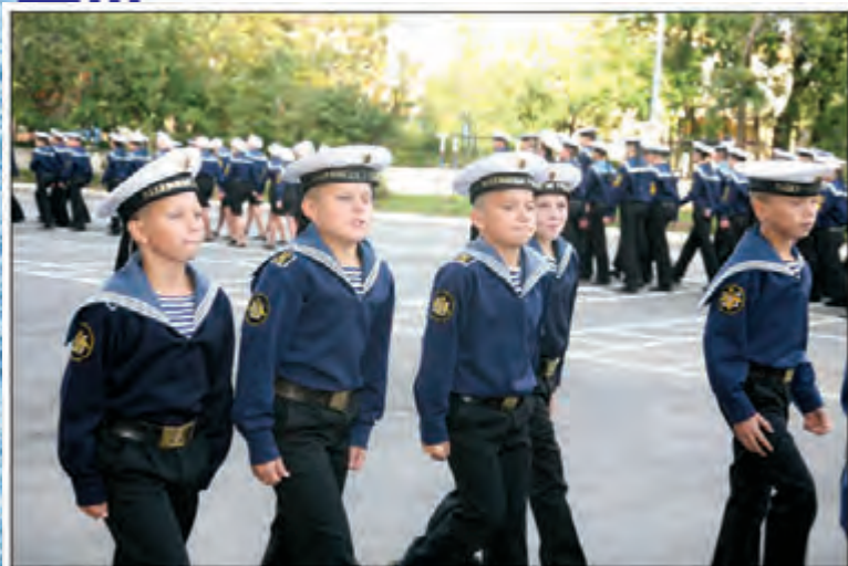
Первый раз в строю

училищах Военно-морских сил». С тех пор воспитанников стали называть «нахимовцами», а первая (старшая) рота переводилась на положение строевых рот.