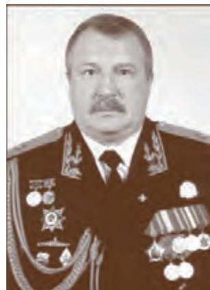
Контр-адмирал А.Н. Букин (2001–2008)