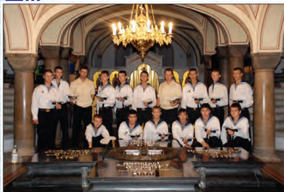
Триқосновение қ морской святыне. Владимирский собор, г. Севастополь

когда приходилось переводить людей в другую роту, если не складывалось взаимопонимание. Ибо все это негативно отражалось на учебе мальчишек, на их отношении к делу. Я нередко советую воспитателям, старшим воспитателям – прежним командирам рот посещать уроки, знать, какой именно материал изучают их подопечные, с какими трудностями встречаются. Потом им проще организовывать самоподготовку. Преподаватели в свою очередь приходят в классы во время самостоятельной работы, чтобы помочь ученикам лучше усвоить материал, подтянуть слабеньких. Подобную