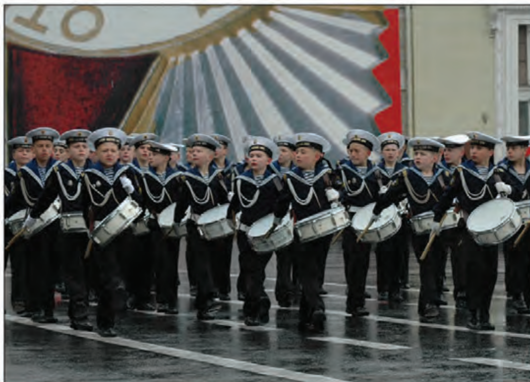
На параде. Дворцовая площадь, 2008 г.

– Если не будет связки воспитатель – преподаватель, то мы будем иметь потери в учебе, в дисциплине и так далее, – говорит он. – Здесь нужна гармония. Мы добиваемся, чтобы и у воспитателей (раньше это были командиры взводов), и у преподавателей были одинаковые взгляды на работу с кадетами. Иначе успеха не видать. У нас были случаи,