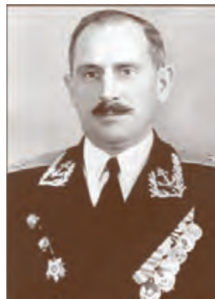
Контр-адмирал Н.М. Багков (1961–1963)