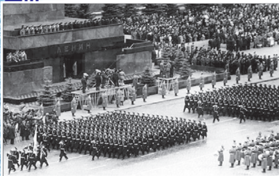
Нахимовцы на параде в Москве