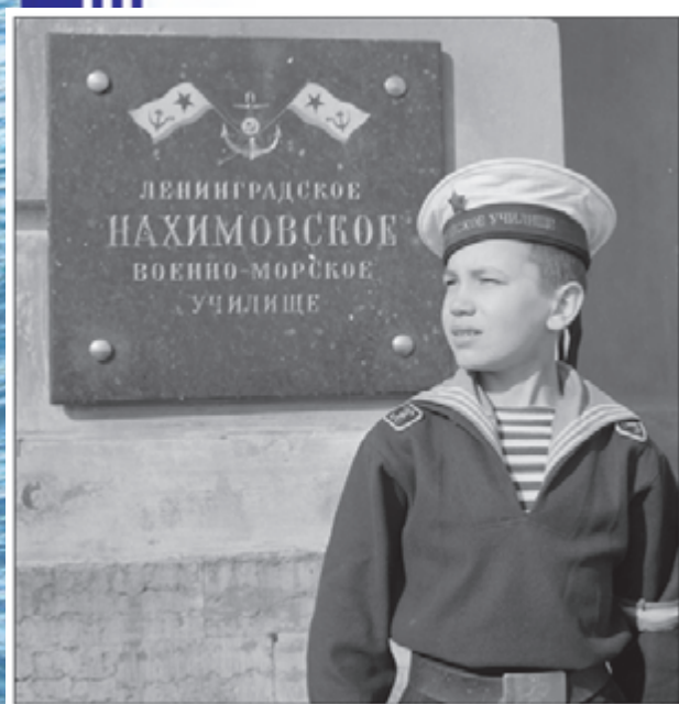
Нахимовец, первого набора