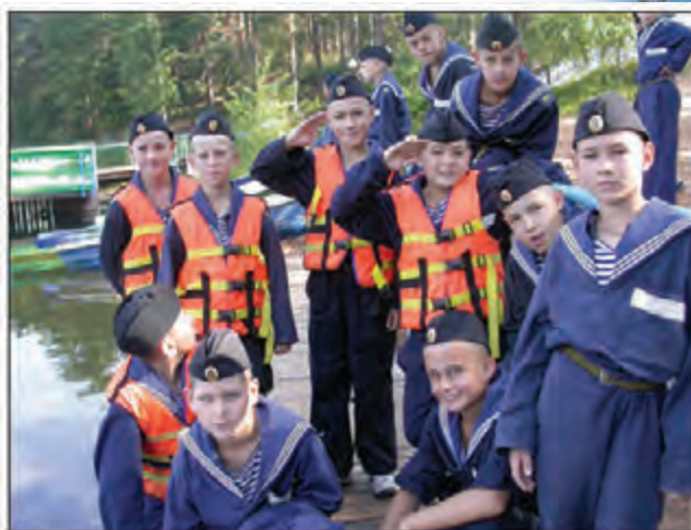
Лагерь. Природа выбирает сильных

что в период подросткового возраста воспитанника кадетского корпуса учителя и офицеры-воспитатели выступают в роли одного из основных агентов профессиональной социализации. И в КМКК все должностные лица – от младшего командира вице-старшины 2 статьи до начальника корпуса – принимают активное участие в воспитании каждого кадета.