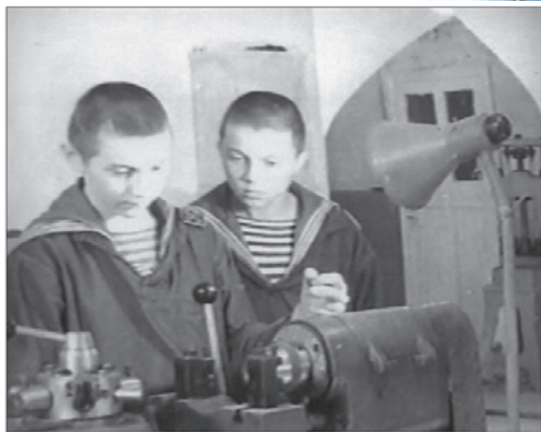
В мастерских Рижского НВМУ