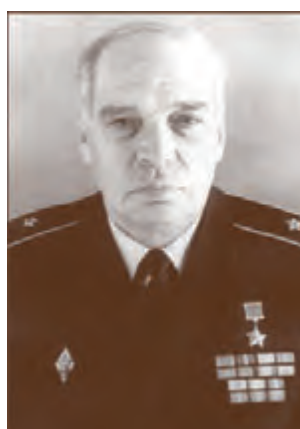
Контр-адмирал А.Н. Столяров (1979–1990)