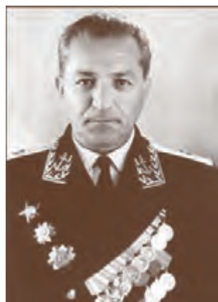
Контр-адмирал В.Г. Бакарджиев (1963–1971)