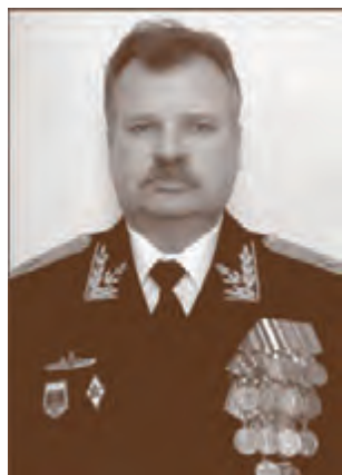
Контр-адмирал А.А. Юргенко (2008)