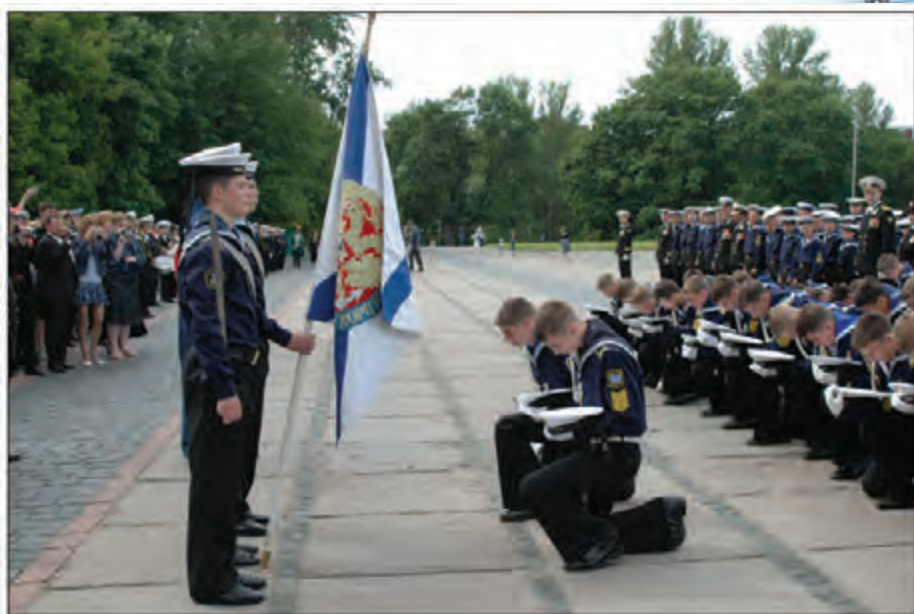
Прощание со знаменем корпуса