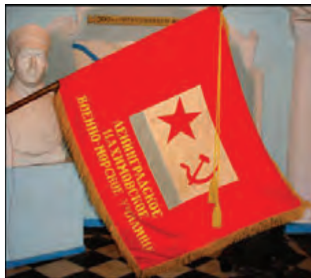
Знамя Ленинградского НВМУ

Следует сказать, что в воспитании принимал участие весь коллектив училища – от руководителей до медработников. Однако основная тяжесть легла на воспитателей. Это – особая категория педагогов. В их число входили: командир роты; офицеры-воспитатели, по одному на взвод; помощники воспитателей из числа старшин; старшина роты. В период формирования училища комплектовались эти должности за счет выздоравливающих офицеров и старшин, как правило, не имевших никакого образования, не говоря уж о педагогическом. Позже, в 1947 г., директивой ГШ ВМФ при Ленинградском НВМУ были организованы годовые курсы по подготовке воспитателей и их помощников. Они находились с