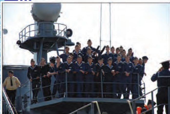
Корабль – дом родной