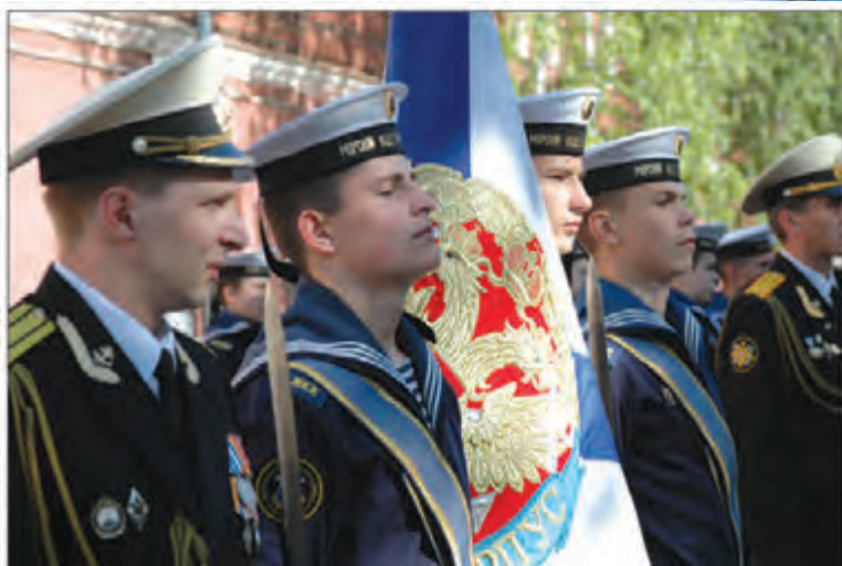
Знамя корпуса – самая дорогая реликвия

И, конечно, в Кронштадте нельзя без моря. В 2009 г. кадеты третий раз ходили в дальний поход на учебном корабле Ленинградской военно-морской базы. На этот раз по