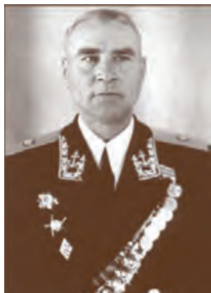
Контр-адмирал Г.Е. Гриуценко (1949–1961)