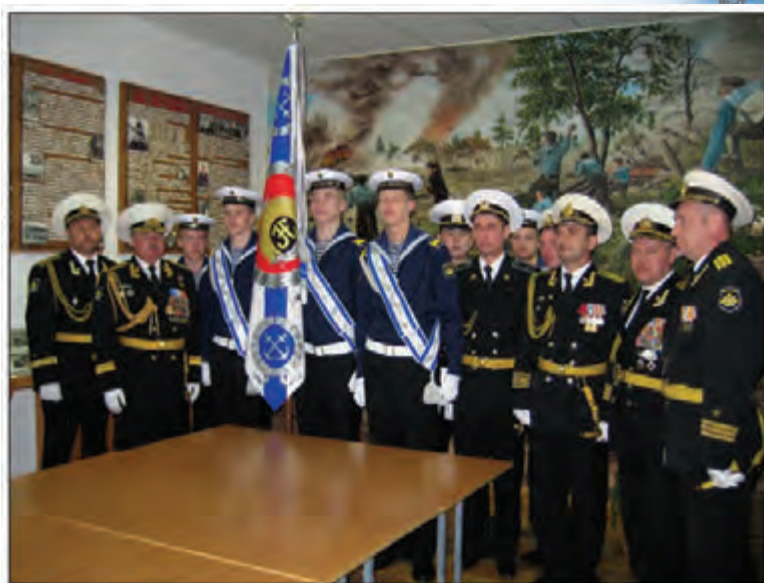
Знамя Нахимовского военно-морского училища

За свою историю Нахимовские училища выпустили в свет около 14 тысяч юношей. Среди них – десятки адмиралов и генералов, деятели искусства, ученые, выдающиеся администраторы. В том числе Главнокомандующий ВМФ России адмирал флота В.С. Высоцкий (выпускник 1971 г.). Героями России стали подводник контр-адмирал А.А. Берзин, генерал-майор авиации ВМФ Т.А. Апакидзе, капитан 1 ранга В. Хмыров. Нахимовцы оказываются во всех «горячих» точках планеты, порой в самых сложных корабельных ситуациях.