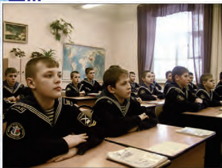
Все внимание – на педагога!