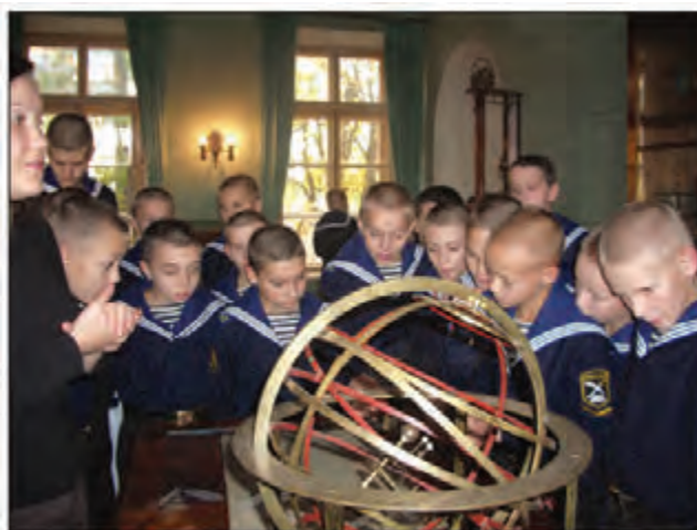
Первое знакомство с астрономией

В дореволюционный период полнота воспитательного процесса в кадетских корпусах в основном определялась состоянием охвата кадет вниманием и заботой их руководителей, а именно: воспитателей, командиров и начальников, педагогов и лиц, в обязанностях которых эта задача выделялась особо. Анализ архивных документов, проведенный специалистами, доказывает, что в императорской России практически во все времена придавалось большое значение подготовке военно-педагогических кадров и офицеров-воспитателей для кадетских корпусов. Это связано с тем,