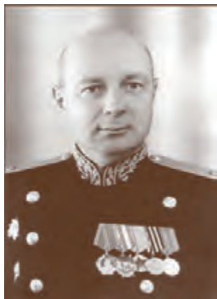
Контр-адмирал Н.Г. Иззгик (1944–1949)