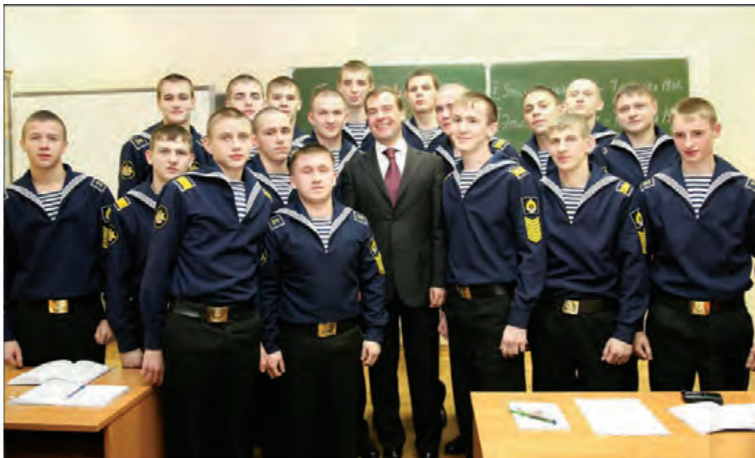
Президент ФФ Д.А. Медведев в НВМУ. 27.01.2009 г.

Нахимовские училища не смогли в полной мере обеспечить набор в военно-морские училища (институты). Их выпускники составляют около 12% всех лейтенантов, вышедших на флот за эти годы. Однако среди нахимовцев относительно больший процент успешных, состоявшихся граждан нашей Родины.