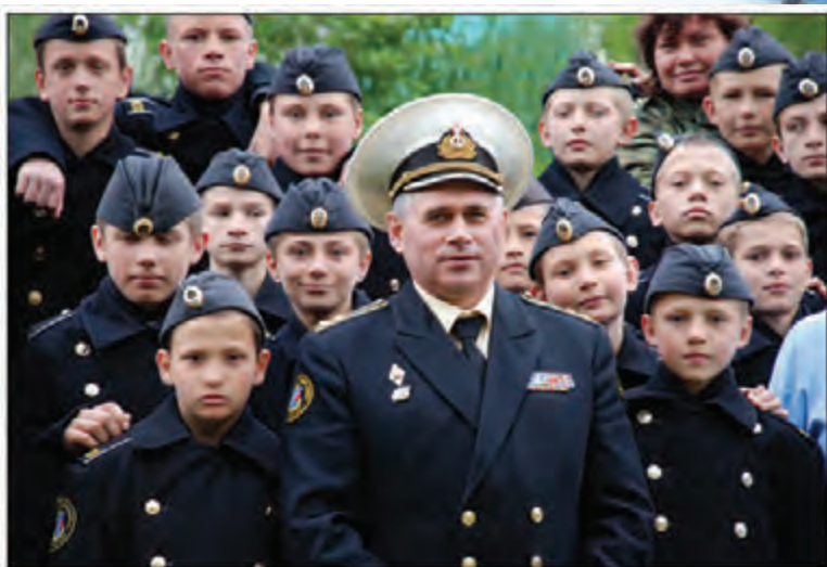
В их глазах светится море