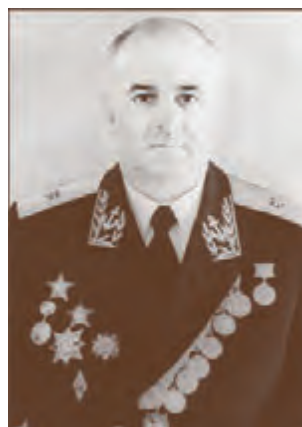
Контр-адмирал П.Г. Беляев (1971–1976)