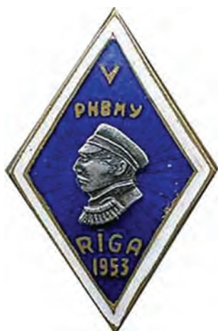
Рижское нахимовское военно- морское училище. Справа – Пороховая башня Торна