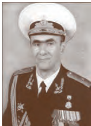
Контр-адмирал Н.Н. Малов (1990–2001)