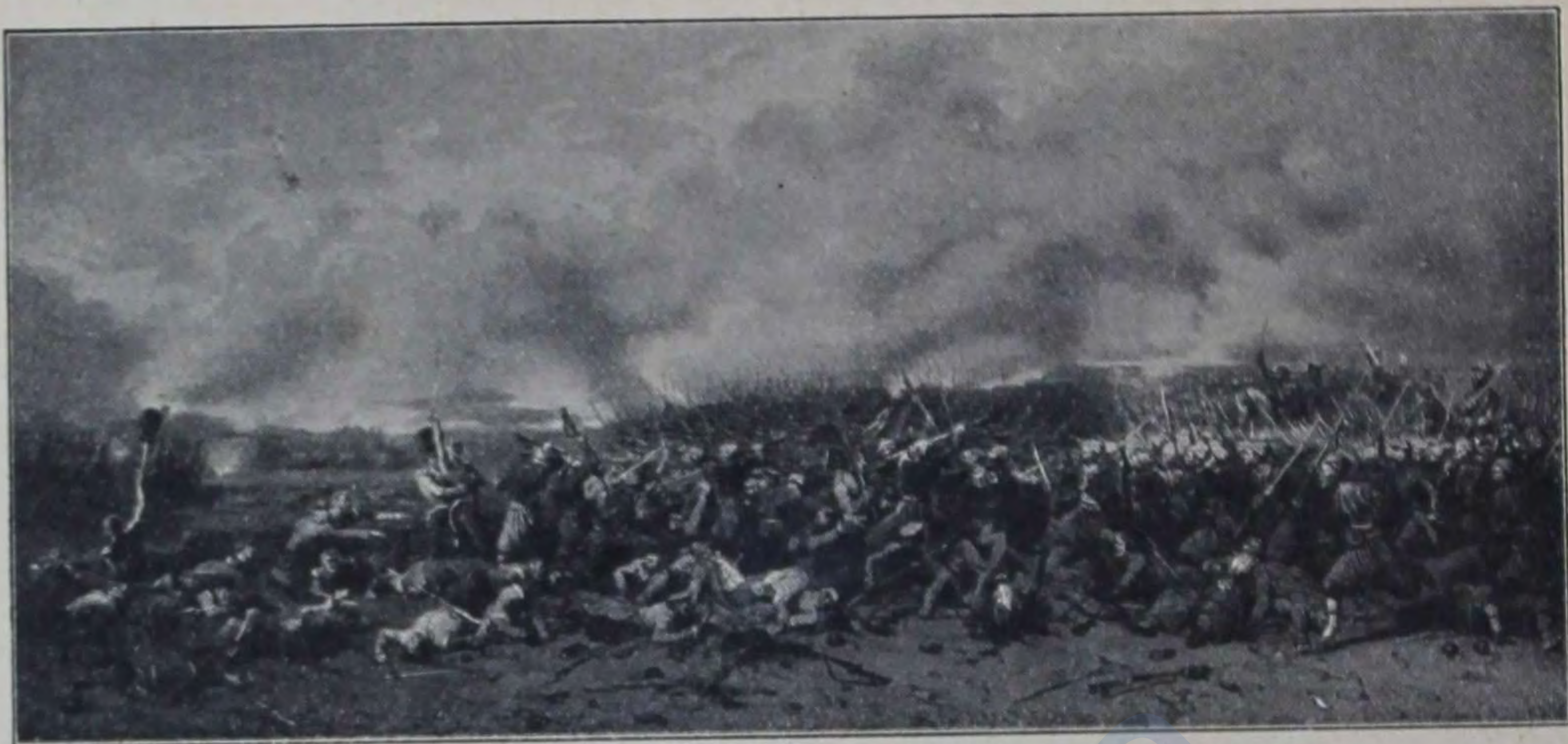
Схватка съ зуавами подъ Инкерманомъ.

станно прибывающими свѣжими силами, французы принудили отступить наши разстроенные, измученные баталіоны.