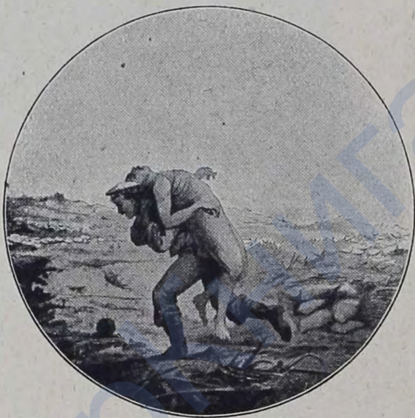
Кошка съ трупомъ сапера.

Особое уваженіе товарищей и общую извѣстность онъ приобрѣлъ слѣдующимъ подвигомъ: въ одной вылазкѣ противъ англичанъ былъ убитъ нашъ саперъ, трупъ котораго англичане врыли по поясъ въ землю, около самой своей траншеи, какъ бы въ видѣ цѣли для нашихъ выстрѣловъ. Такое поруганіе возбудило всеобщее негодованіе, и удалой Кошка вызвался вырыть и принести тѣло убитаго товарища. Получивъ разрѣшеніе, Кошка отправился на свой славный подвигъ и, въ виду изумленныхъ