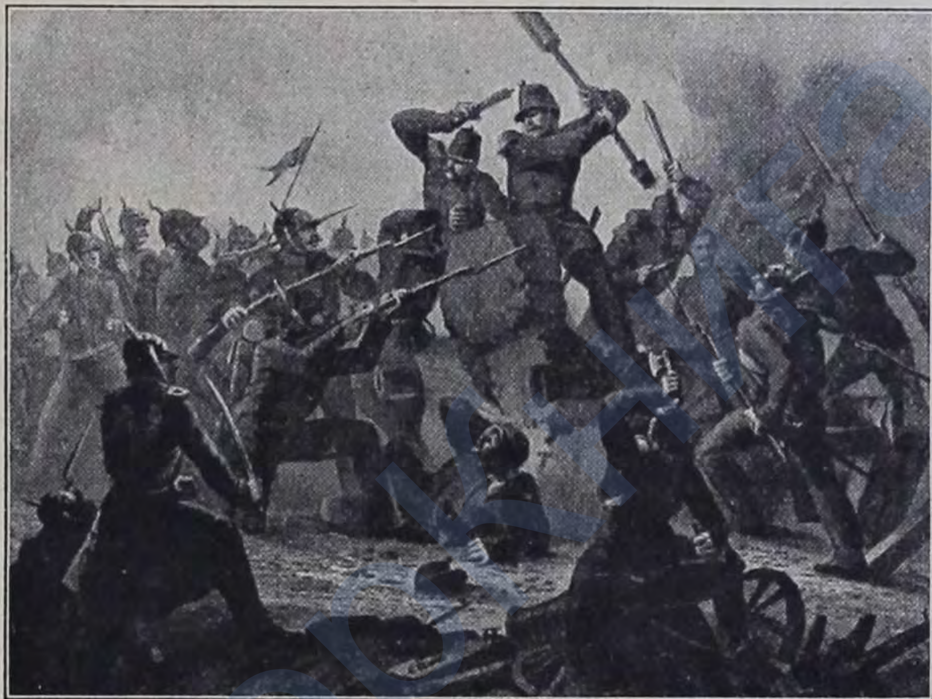
Вылазка изъ Севастополя.

Безъ шума и грома приближалась, обыкновенно, чуть не ползкомъ молодецкая команда, и, вдругъ, съ крикомъ „ура“, ворвется въ непріятельскую траншею, сроетъ насыпь, разбрасаетъ туры, мѣшки, фашины и схватится въ рукопашную. Сдѣлавъ свое