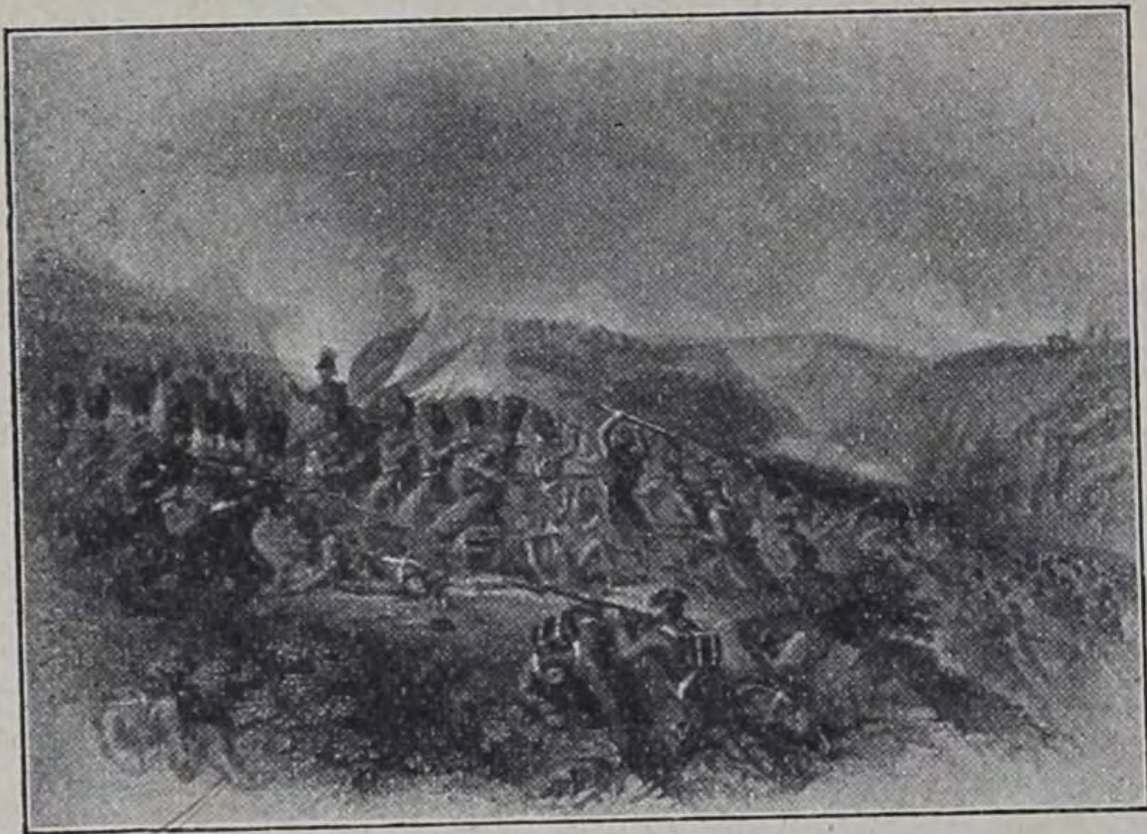
Атака русскихъ подѣ Инкерманомъ.

Здѣсь тарутинцы и бородинцы бросились на англійскую батарею и, хотя были встрѣчены залпомъ съ 60 шаговъ, но овладѣли ею, при чемъ Тарутинскаго полка прапорщикъ Соловьевъ и унтеръ-офицеръ Яковлевъ первые бросились на валъ батареи, на штыки непріятельскіе, а за ними ворвались ожесточенные солдаты.