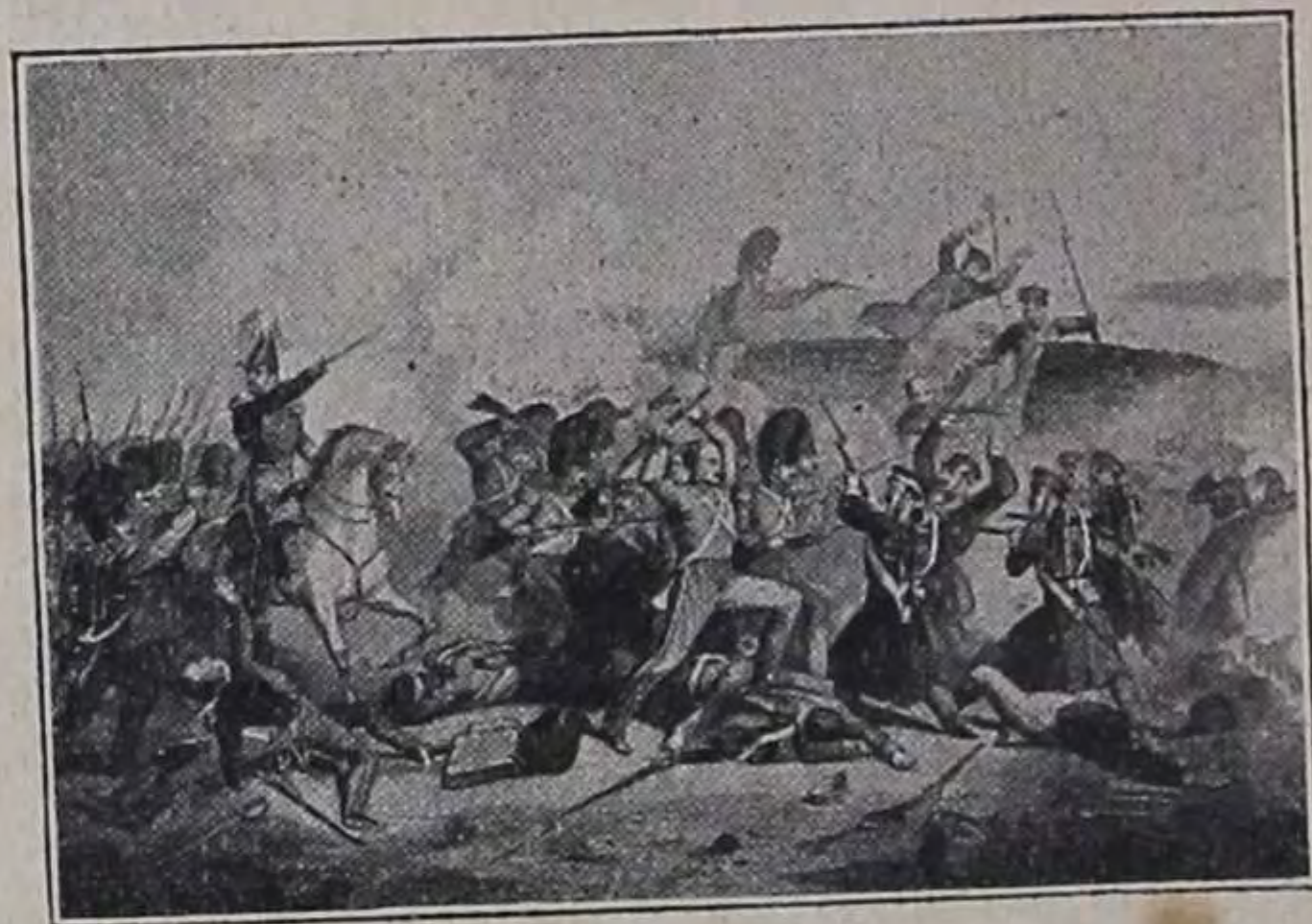
Схватка съ англичанами.

Ихъ смѣняють охотцы , якутцы и селенгинцы . Охотцы стремительно атаковали сильную англійскую батарею. Ее защищали знаменитые англійскіе черные стрѣлки (кольдестримцы). Дстойно помѣрились противники: ударили въ рукопашную, дрались штыками, прикладами, обломками оружія, камнями. Но поддержали храбрые охотцы свою честь и взяли англійскую батарею, хотя при этомъ большая часть полка легла на полѣ битвы.