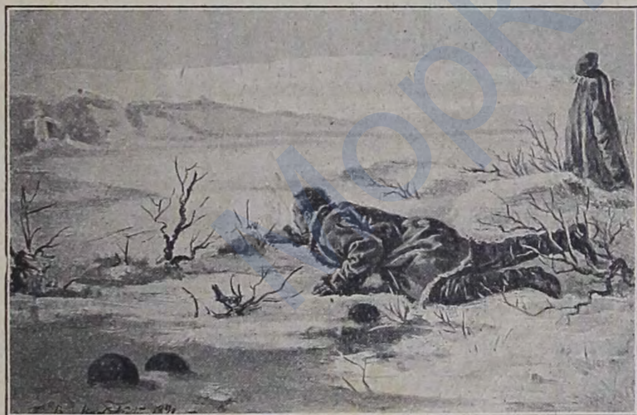
Кошка подкрадывается къ непріят. часовому.

каждый день старались чѣмъ-нибудь досадить непріятелю. Изъ этихъ смѣльчаковъ образовывались особыя команды охотниковъ, которые