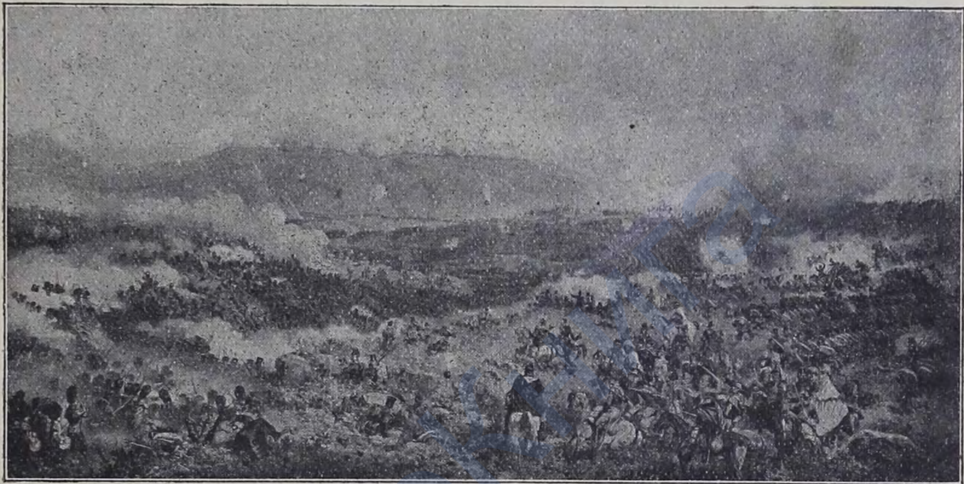
Генералъ Боске спасаетъ англичанъ подъ Инкерманомъ.

Но и къ намъ шла поддержка — якутцы и селенгинцы ударили съ охотцами въ штыки, и англійская гвардія вновь уступила храбрецамъ батарею. Новыя атаки англичанъ повели къ тому, что наши полки окружили ихъ со всѣхъ сторонъ, били