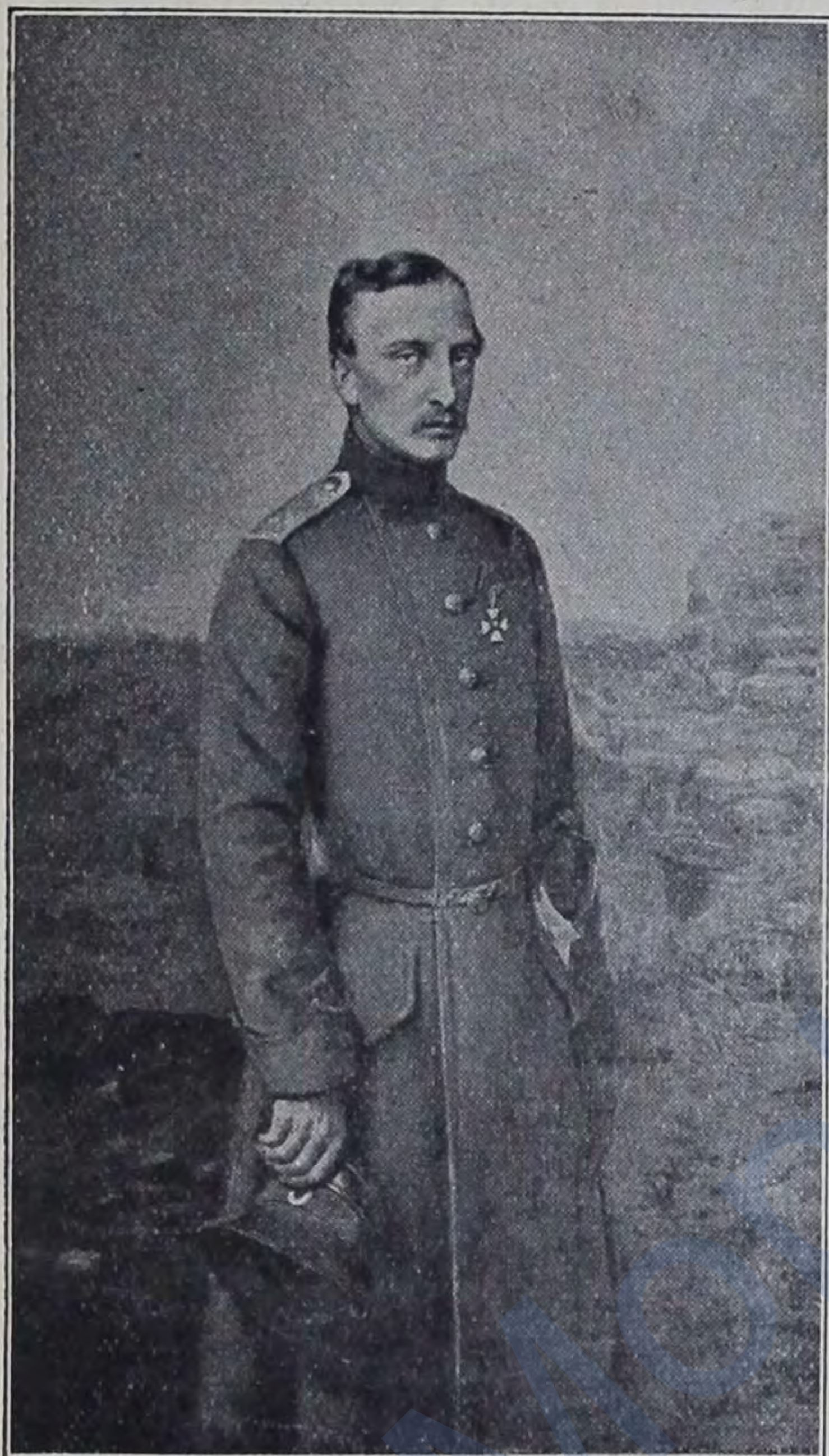
Вел. Кн. Николай Николаевичъ.

Когда послѣ Инкерманскаго сраженія наши войска отступали, и многіе изъ оставшихъ за ранами садились, не имѣя силъ двигаться дальше, появилась между ранеными старушка-матроска