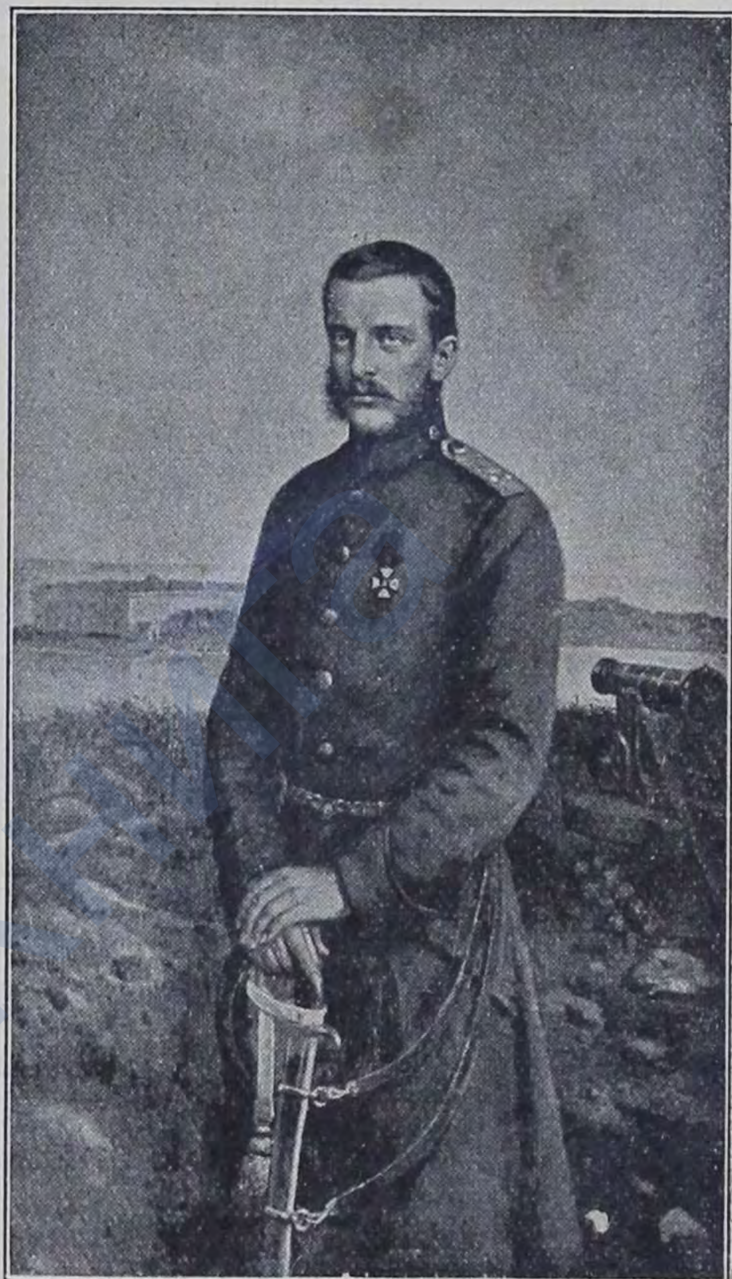
Вел. Кн. Михаилъ Николаевичъ.

съ большимъ горшкомъ, сковородой и вязанкой дровъ. Живо разложила она огонекъ и начала печь оладьи, утоляя голодь раненыхъ. Многимъ спасла жизнь эта своевременная помощь доброй старушки, давъ силъ добраться до своихъ. Когда солдаты хотѣли разсчитаться съ благодѣтельной матроской, она незамѣтно скрылась.