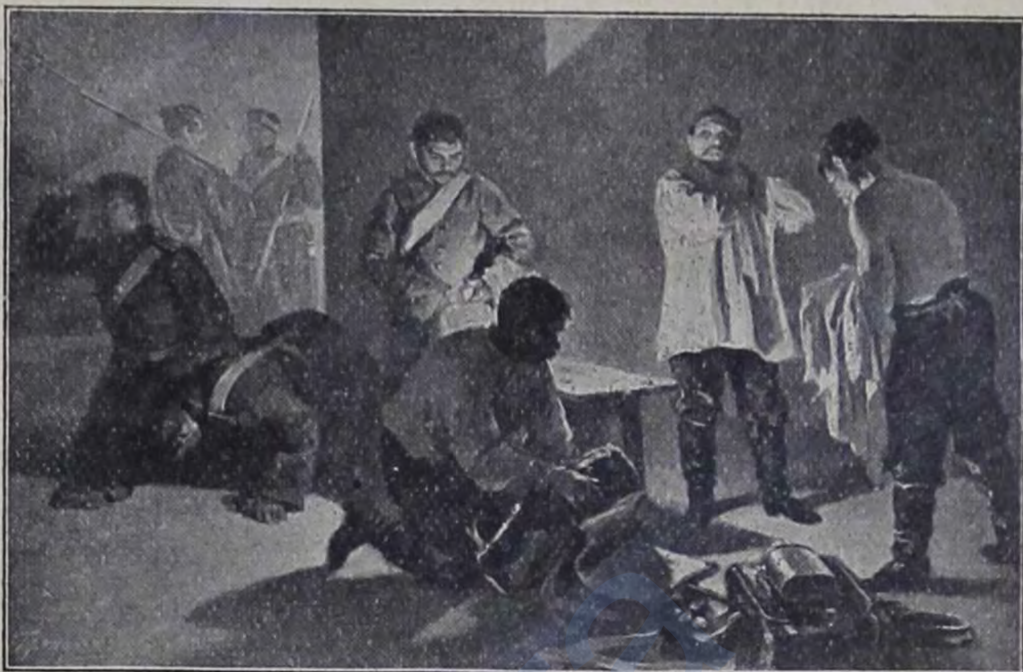
Приготовленіе въ ночную.

Не мало было такихъ смѣльчаковъ среди гарнизона Севастопольскаго, въ особенности изъ черноморскихъ пластуновъ, которые не могли спокойно усидѣть въ нашихъ укрѣпленіяхъ и